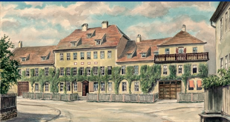
Schömannsches Haus am Engelpfad, Aquarell von Hans Fischer, um 1960, nach einer Lithografie 1899

Der 14. Tag der Stadtgeschichte ist eine Veranstaltung der Stadt Jena, die von JenaKultur organisiert und durchgeführt wird unter Mitwirkung verschiedener Institutionen, Vereine und Akteure der Stadtgeschichtsforschung.