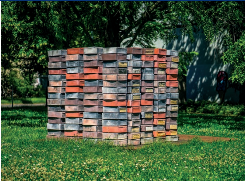
Denkmal für die politisch Verfolgten 1945-1989 in der Gerbergasse 18